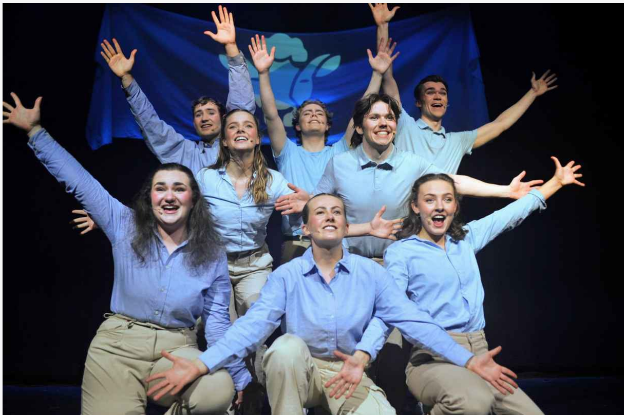
Skodespelarane på Vekerevyen 2023.